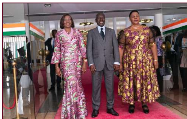
Mme Mabel Memory CHINOMONA, Présidente du Sénat du Zimbabwe (à droite), Mme Kandia CAMARA, Présidente du Sénat ivoirien (à gauche) et M. Adama BICTOGO, Président de l'Assemblée nationale (au centre)

L'Union Parlementaire Africaine (UPA) est une Organisation interparlementaire continentale créée à Abidjan le 13 Février 1976. Elle s'est donnée pour objectif de promouvoir l'unité d'action des Institutions Parlementaires des Etats Africains.