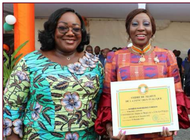
La Présidente du Sénat, Madame Kandia CAMARA (à droite) et Madame Anne Désirée OULOTO, Ministre d'Etat, Ministre de la Fonction Publique et de la Modernisation de l'Administration

Décorée pour son parcours inspirant, Madame Kandia CAMARA a traduit sa reconnaissance et son infinie gratitude au Président de la République, Son Excellence Monsieur Alassane OUATTARA, pour sa confiance ainsi que pour l'honneur qu'il lui fait à travers cette distinction.