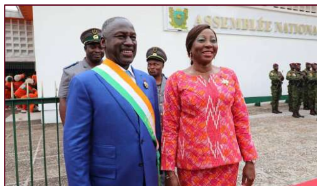
Madame Kandia CAMARA, Présidente du Sénat et Monsieur Adama BICTOGO, Président de l'Assemblée nationale

Pour rappel, la cérémonie solennelle de clôture de la deuxième session 2023 de l'Assemblée nationale intervient sept (07) jours ouvrables après celle du Sénat, conformément aux dispositions de l'article 94 nouveau de la Constitution.