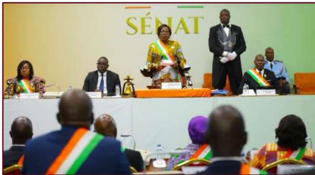
Allocution de Madame Kandia CAMARA, Présidente du Sénat

La Présidente du Sénat, Madame Kandia CAMARA, a procédé à la clôture de la deuxième session ordinaire 2023 de la chambre haute du Parlement, le mardi 19 décembre 2023 à Yamoussoukro.