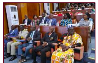
Au premier rang, les autorités préfectorales, administratives, politi- ques et coutumières présentes

A l'occasion de cette cérémonie solennelle, la Présidente du Sénat a prononcé son discours de clôture axé sur la présentation des grandes lignes du