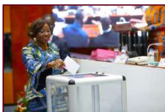
Vote à la tribune de la Présidente du Sénat pour le projet de loi de finances portant budget de l'Etat pour l'année 2024

Au terme de cette séance, les cinq (05) projets de loi soumis à la délibération de l'ensemble des Sénateurs ont été, chacun, adoptés à l'unanimité.