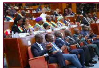
Au premier rang, les Présidents d'Institutions présents à la cérémonie

Plusieurs autres personnalités ont pris part à la séance, notamment des Présidents d'Institutions, des membres du corps diplomatique, des Ministres Gouverneurs, des membres du corps préfectoral ainsi que d'autres autorités administratives, politiques et coutumières.