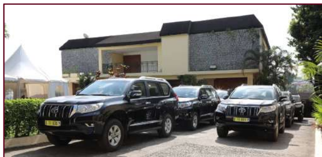
Les nouveaux véhicules de fonction offerts par la Présidente du Sénat aux Présidents de Commission

Le mercredi 13 décembre 2023, la Présidente du Sénat, Madame Kandia CAMARA, a procédé à la remise officielle de véhicules de fonction aux Présidents des commissions permanentes du Sénat.