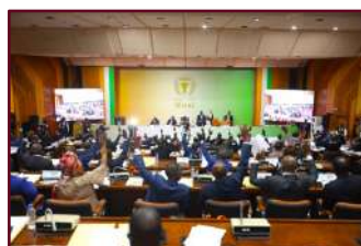
Vote à main levée des Sénateurs