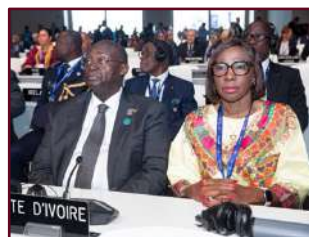
Au premier plan) Le vice-Président de la République, Monsieur Tiémoko Meyliet KONÉ, et la Présidente du Sénat, Madame Kandia CAMARA

Lors de ce rendez-vous international, la délégation ivoirienne a organisé un atelier de présentation de "Abidjan Legacy program". Elle a également pris part à plusieurs autres activités.