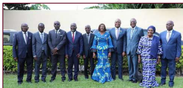
Photo de famille de la Présidente du Sénat avec les Présidents de Commission et les vice-Présidents présents à la cérémonie