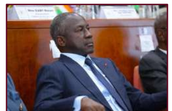
Monsieur Adama BICTOGO, Président de l'Assemblée nationale

Plusieurs autres personnalités ont pris part à la séance, notamment des Présidents d'Institutions, des membres du corps diplomatique, des Ministres Gouverneurs, des membres du corps préfectoral ainsi que d'autres autorités administratives, politiques et coutumières.