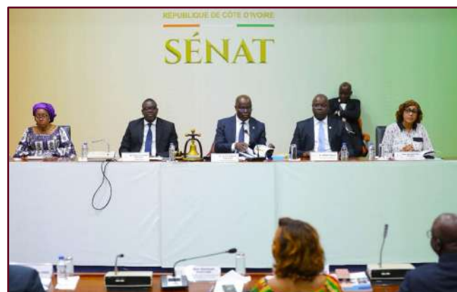
Table de séance lors de la présentation du rapport 2022 du CNDH au Sénat

Il exerce les fonctions de conseil, de consultations, de conduite des missions, d'évaluation et d'études thématiques tout en faisant des propositions pour le renforcement des droits de l'homme en Côte d'Ivoire.