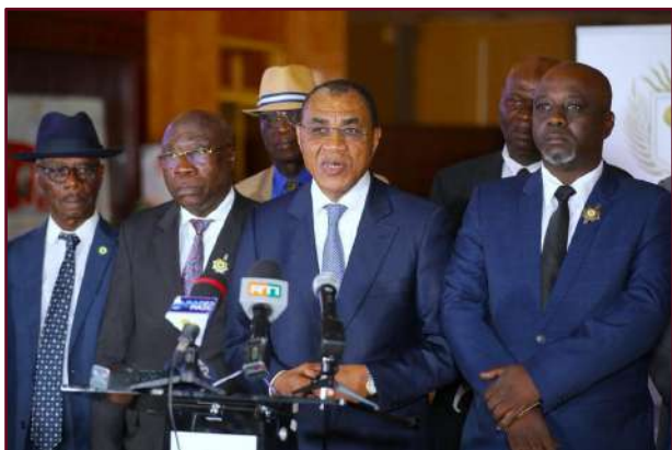
Point de presse avec le Ministre des Finances et du Budget, Monsieur Adama COULIBALY, à l'issue des travaux de la CAEF

L'article 111 de la Constitution ivoirienne dispose que « Le Parlement vote le projet de loi de finances, dans les conditions déterminées par la loi organique ».