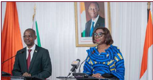
La Présidente du Sénat ivoirien, Madame Kandia CAMARA, et le Président du Sénat Burundais, Monsieur Emmanuel SINZOHAGERA

La Présidente du Sénat de Côte d'Ivoire, Madame Kandia CAMARA, a reçu en audience son homologue du Sénat du Burundi, Monsieur Emmanuel SINZOHAGERA, le mercredi 13 décembre 2023, à la permanence du Sénat à Abidjan.