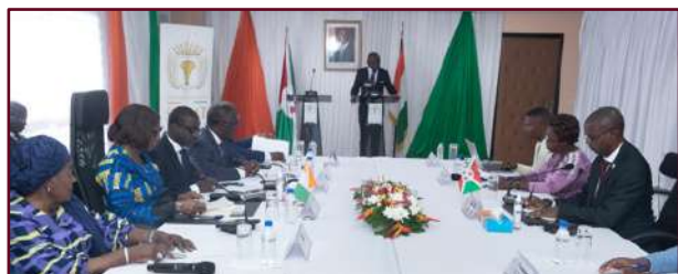
Séance de travail entre les deux délégations

Notons que la délégation burundaise était présente en Côte d'Ivoire dans le cadre de la 80ème session du comité exécutif de l'Union Parlementaire Africaine (UPA).